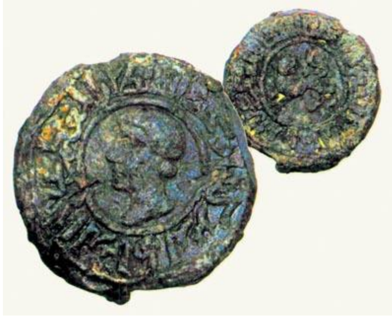
Alâeddîn Keykubad'ın 10 yıl önce bulunan, Laskaridler'le mücâdele ettiği döneme âit mührü üzerindeki orijinal resmi. 2,5 cm., 4 mm., 15.8 gr. Antalya Müzesi, Env. nr.: B-112.