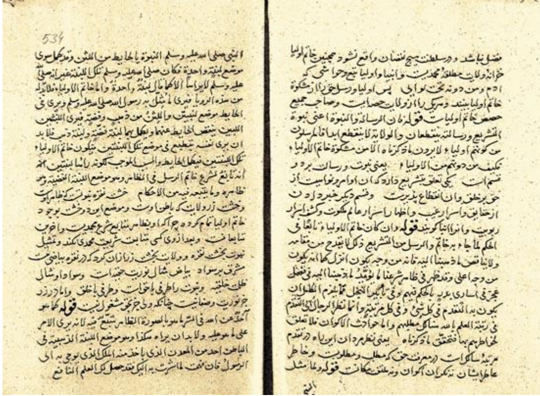
Seyyid Ali el-Hemedâni -kuddise sirruh- Hazretleri'nin " Hâtemü'l-velâye " hakkında son derece mühim ifşaatlarda bulunduğu " Şerh-i Fusûsü'l-Hikem " adlı eserinden iki yaprak. Süleymâniye Ktp. Şehid Ali Paşa, nr.: 2794/37, vr. 533 b -534 a

| Hakikat'te Bu Ay | Diğer Sayılar | Ana Sayfa |