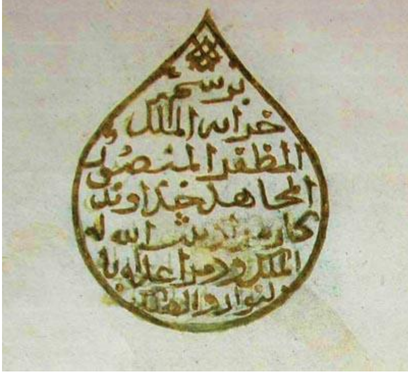
"Tuhfetü'l-Guzât fî Fezâ'ilü'l-Cihâd"ın zahriyyesindeki Gâzî Hüdâvendigâr adına yazıldığını gösteren ve Sultan Murâd'ın saltanatının devâmı için duâ ifâdeleri içeren serlevha. Edirne Selimiye Ktp. Yzm. nr.: 858, vr. 1 a .