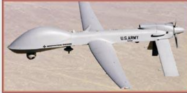
"Predator" isimli İnsansız Hava Araçları Afganistan ve Pakistan'da yüzlerce sivilin ölümüne sebep oldu.