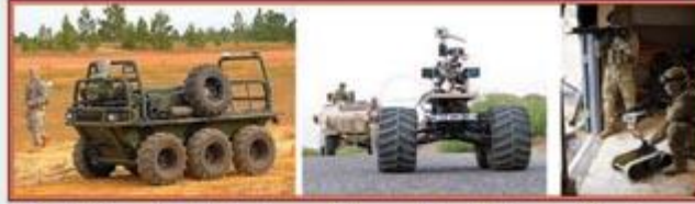
Robotlar, korkak Amerikan askerinin yerini alıyor.

"Amerikan ordusu modernize ediliyor. Ordunun 'geleceğin muharebe sistemi'yle donatılmasını öngören 15 milyar dolarlık program uyarınca, 2010'a dek kısmen ya da tamamen robotlaştırılmış kara araçları devreye girecek. ... Bazısı mürettebatsız kullanılabilen 18 savaş aracı, hafiflikleri sayesinde nakliye uçaklarıyla dünyanın her yerine taşınabilecek ve gelişmiş iletişim donanımıyla muharebe alanının ayrıntılı görüntülerini elde edebilecek."