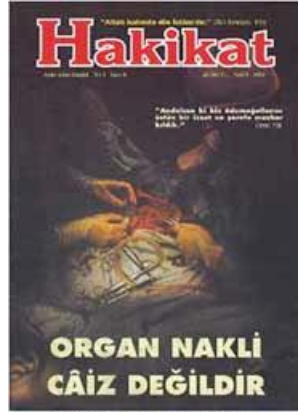
Mart 1994 tarihli Hakikat Dergisi'nin 6. Sayısı