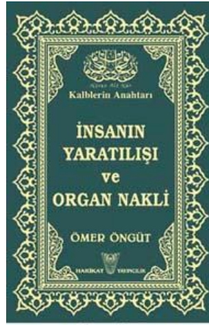
Muhterem Ömer Öngüt -kuddise sırruh- Hazretleri'nin bu eserin ilk baskısı 1990 yılında yapılmıştır.

Bu hususta Muhterem, Merhum Ömer Öngüt -kuddise sırruh- Hazretleri "İnsanın Yaratılışı ve Organ Nakli" isminde müstakil bir eser neşretmişlerdir. İlk baskısı 1990 yılında yapılan bu eserden derlediğimiz bu ayki konumuzu ümmet-i Muhammed'in istifadesine arz ediyoruz.