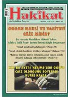
Temmuz 2001 tarihli Hakikat Dergisi'nin 94. Sayısı