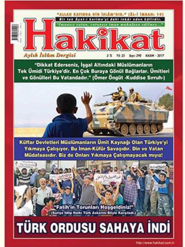
İdlip Operasyonu ile Türk Ordusu'nun Suriye'ye girmesi üzerine yayınlanan dergimizin kapağı. Kasım 2017, 290. Sayı.

"Yâ Rabb'i! Halilullah Mekke İçin Duâ Etti. Yâ Rabb'i! Resulullah Medine İçin Duâ Etti. Yâ Rabb'i! Fakir Bu Devlet İçin Duâ Ediyor, Bu Devlete Zevâl Verme!"