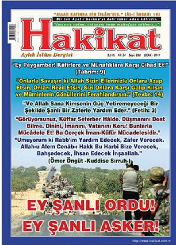
"Fırat Kalkanı" Operasyonu vesilesi ile yayınlanan dergimizin kapağı. Ocak 2017, 280. Sayı.