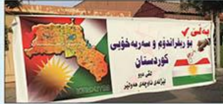
Kuzey Irak sokaklarında "Büyük Kürdistan" haritaları yanında "Kürdistan'ın Bağımsızlığı İçin Referandum" "Kürdistan Devleti'ne Evet" gibi yazılar bulunan afişler