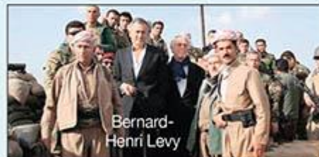
Kürtlerin başından eksik olmayan yahudiler