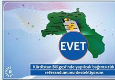
Barzani medyası Rudaw'da yayınlanan harita