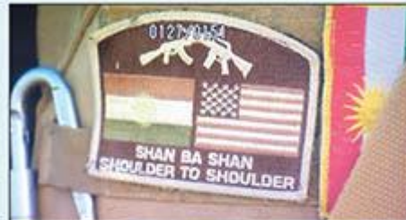
Peşmergenin omuzunda Amerikan ve Kürdistan bayrağı ve altında "Omuz omuza" yazısı