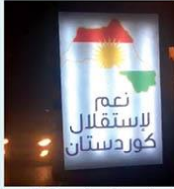
Referandum öncesi gazeteci M. Akif Ersoy'un yaptığı yayında Erbil sokaklarındaki bütün billboardlarda altında "Bağımsız Kürdistan'a Evet" yazan "Büyük Kürdistan" haritaları görülüyor.